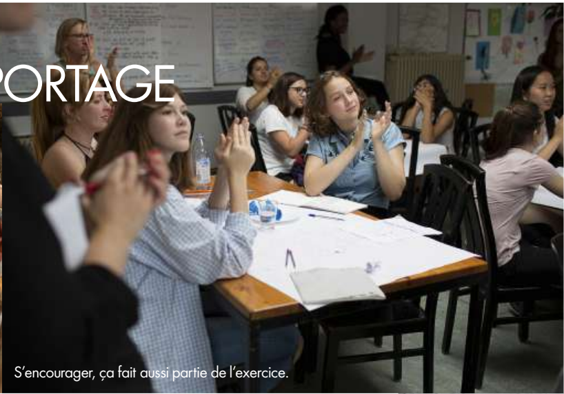
S'encourager, ça fait aussi partie de l'exercice.