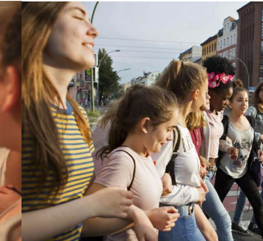
Hyper motivées, les filles vont écouter une conférence donnée par une femme d'exception.