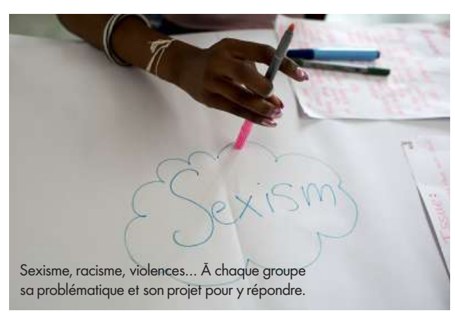
Sexisme, racisme, violences... À chaque groupe sa problématique et son projet pour y répondre.