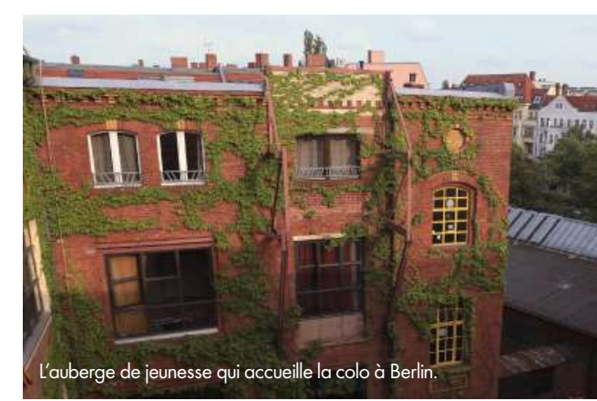
L'auberge de jeunesse qui accueille la colo à Berlin.