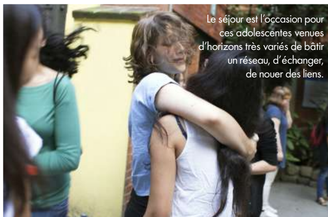
Le séjour est l'occasion pour ces adolescentes venues d'horizons très variés de bâtir un réseau, d'échanger, de nouer des liens.